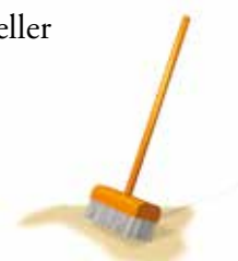
Efterfyll alla fogar.