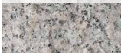
GRÅ BOHUS ELEGANT (FLAMMAD)