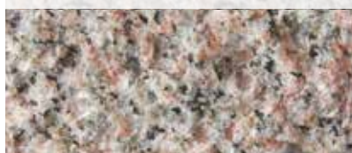
RÖD BOHUS FINNESS (KRYSSHAMRAD)