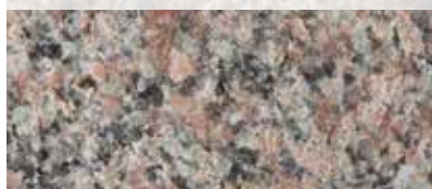
RÖD BOHUS ELEGANT (FLAMMAD)