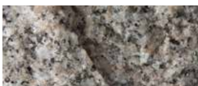
GRÅ BOHUS RUSTIK (RÅKILAD)

Finess – förfinad, återhållsam, krysshamrad på alla synliga sidor.