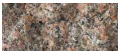
RÖD BOHUS RUSTIK (RÅKILAD)